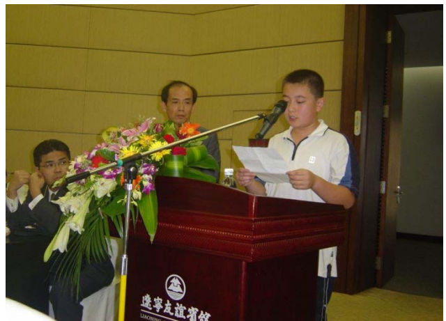
심포지엄 선언 채택