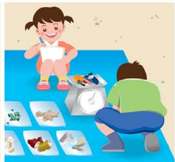
④ 표착물의 개수·중량을 조사표에 기입합니다.