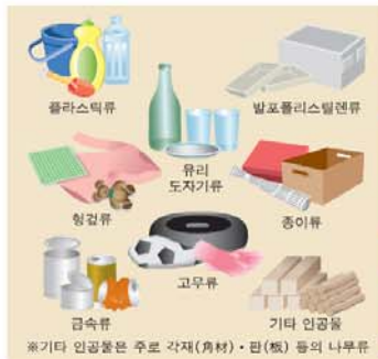
③ 표착물을 구분합니다.