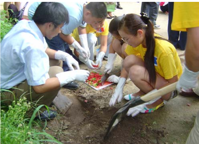
공동야외환경보전활동 (음식물쓰레기로 퇴비만들기)