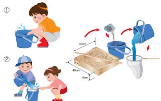
매물물 조사 채취 순서