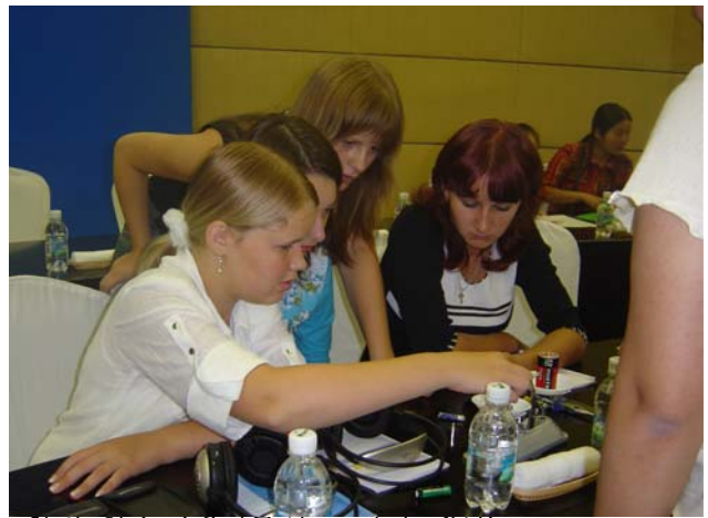
환경 학습 (폐기물의 측정과 계산)