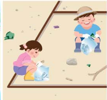
② 표착물을 수집합니다.