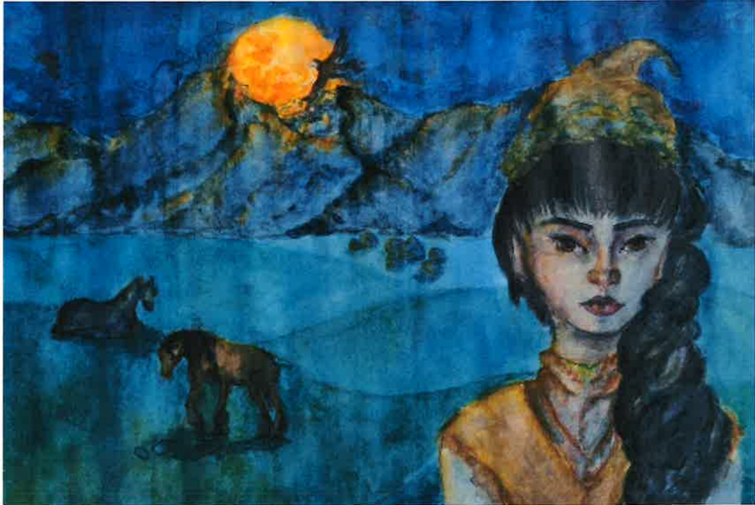
최우수상 몽골 어딘가에서_러시아 이르쿠츠크주 슈시나 예바

[경남에나뉴스 서덕수 기자] 경상북도는 이달 17일부터 28일까지 12일간 도청 동락관에서 동북아시아지역자치단체연합사무국의 후원으로 동북아 5개국(한·중·일·몽·러) 청소년 그림포스터 공모전 수상작 전시회를 연다.