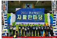
다시 도전! 새로운 변화! 희망의 자활