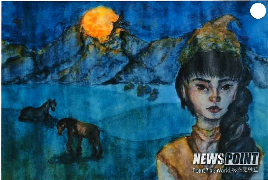
▲ 최우수상 몽골 어딘가에서_러시아 이르쿠츠크주 슈시나 예바

뉴스포인트 박마틴 기자 | 경상북도는 이달 17일부터 28일까지 12일간 도청 동락관에서 동북아시아지역자치단체연합사무국의 후원으로 동북아 5개국(한·중·일·몽·러) 청소년 그림포스터 공모전 수상작 전시회를 연다.