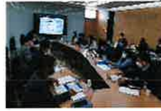
경북도 혁신도시 발전계획 수립 용역 착수