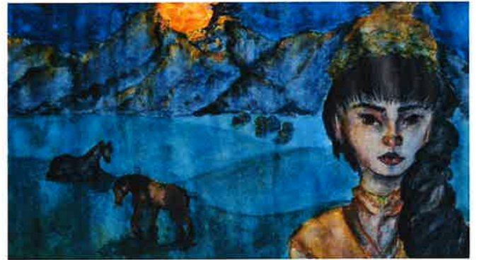
경북도, 동북아 5개국 문화 그림으로 보여준다

경북도 는 이달 17일부터 28일까지 12일간 도청 동락관에서 동북아시아 지역자치단체연합사무국(사무총장 김옥채)의 후원으로 동북아 5개국(한·중·일·몽·러) 청소년 그림포스터 공모전 수상작 전시회를 연다.