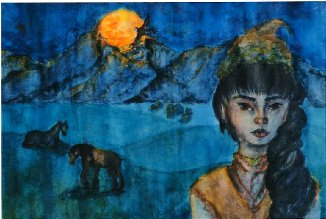
▲ 최우수상 몽골 어딘가에서_러시아 이르쿠츠크주 슈시나 예바

[케이에스피뉴스=김연실 기자 kspa@kspnews.com ] 경상북도는 이달 17일부터 28일까지 12일간 도청 동락관에서 동북아시아지역자치단체연합사무국의 후원으로 동북아 5개국(한·중·일·몽·러) 청소년 그림포스터 공모전 수상작 전시회를 연다.