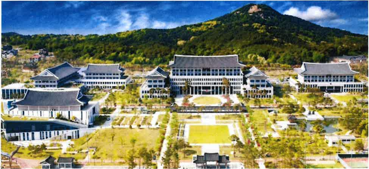
▲ 경북도 동북아 5개국 문화, 그림으로 만난다!

[케이에스피뉴스=김연실 기자 kspa@kspnews.com] 동북아시아지역자치단체연합(NEAR)사무국은 8월 14일부터 12월 15일까지 4개월간 경상북도를 시작으로 포항시, 울산광역시, 광주광역시, 세종특별자치시에서 동북아 5개국(한·중·일·몽·러) 청소년 그림 공모전 수상작 순회 전시회를 개최한다.