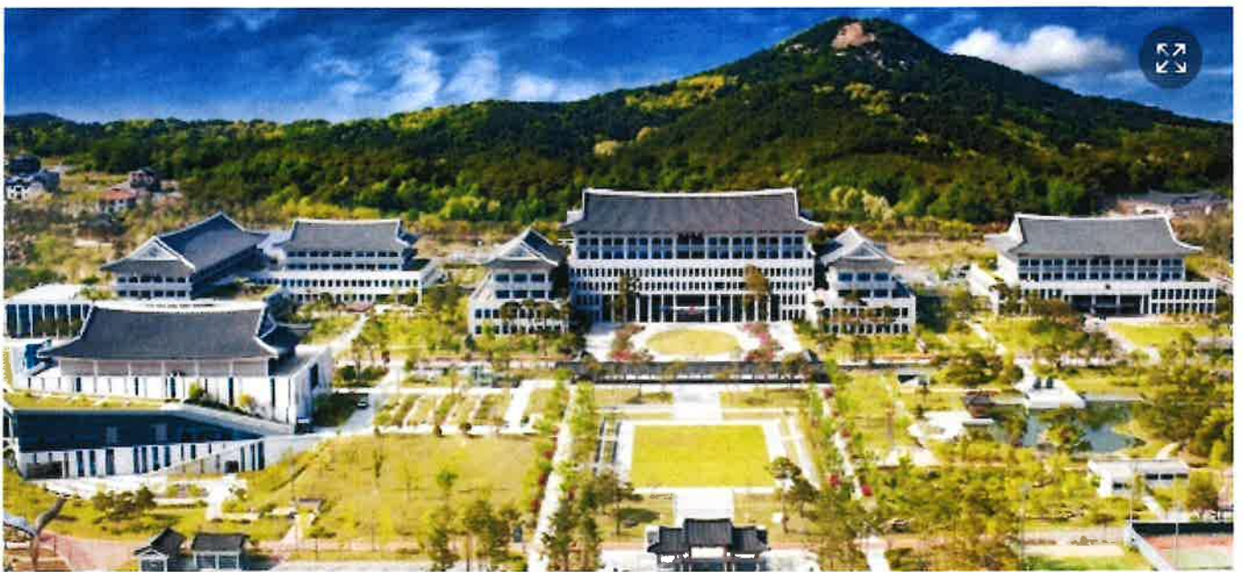
▲ 경북도 동북아 5개국 문화, 그림으로 만나다!

[성남신문=성남신문] 동북아시아지역자치단체연합(NEAR)사무국은 8월 14일부터 12월 15일 까지 4개월간 경상북도를 시작으로 포항시, 울산광역시, 광주광역시, 세종특별자치시에서 동북아 5개국(한·중·일·몽·러) 청소년 그림 공모전 수상작 순회 전시회를 개최한다.