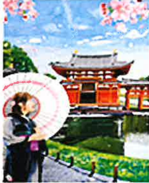
2022 장려 일본 효고현 「和」 (일본의 전통)