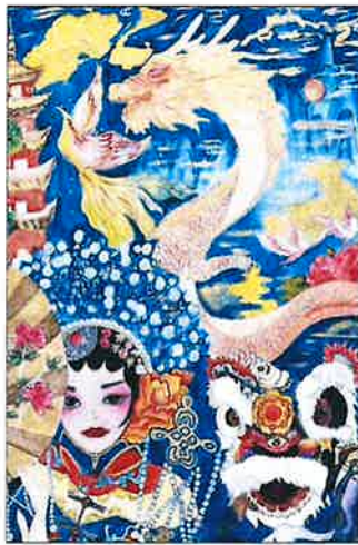
중국 안후이성 '전승'

이번 전시에는 '동북아지역 문화'를 주제로 한 동북아시아 청소년들이 바라보고 생각한 각국의 전통문화부터 자연경관, 거리모습, 문화축제 등이 담겨진 역대 공모전 수상작 70여점이 전시될 예정