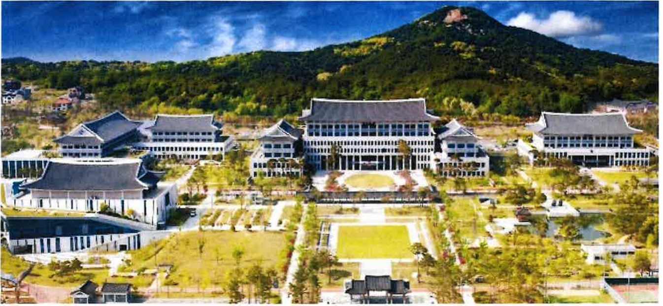
▲ 경북도 동북아 5개국 문화, 그림으로 만나다!

(정도일보) 동북아시아지역자치단체연합(NEAR)사무국은 8월 14일부터 12월 15일까지 4개월간 경상북도를 시작으로 포항시, 울산광역시, 광주광역시, 세종특별자치시에서 동북아 5개국(한·중·일·몽·러) 청소년 그림 공모전 수상작 순회 전시회를 개최한다.