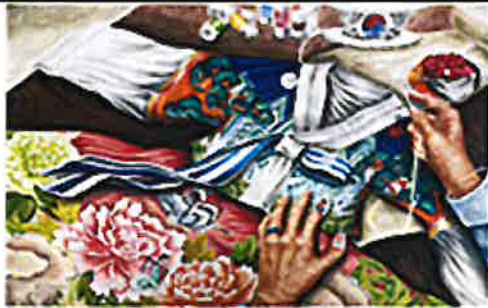
2022 장려 한국 대구광역시 미(美)