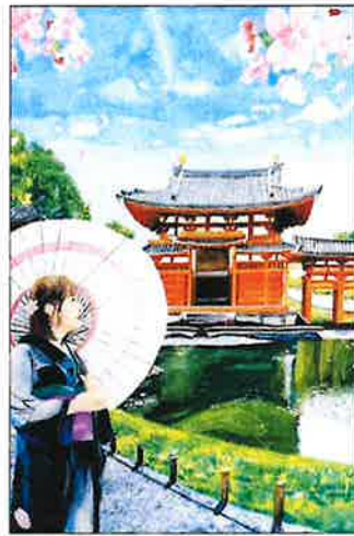
일본 효고현 '와(일본의 전통)'

올해는 축제로 보는 동북아시아(가고 싶은 축제, 소개하고 싶은 축제)라는 주제로 지난 3월부터 청소년 그림을 접수