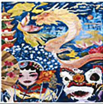
2022 최우수 중국 안후이성 전승