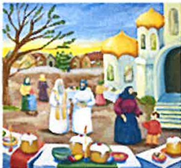
2022 장려 러시아 톰스크주 러시아의 부활절

이번 전시에는 '동북아시아 문화'를 주제로 한 동북아시아 청소년들이 바라보고 생각한 각 국의 전통문화부터 자연경관, 거리모습, 문화축제 등이 담겨진 역대 공모전 수상작 70여점이 전시될 예정이다.