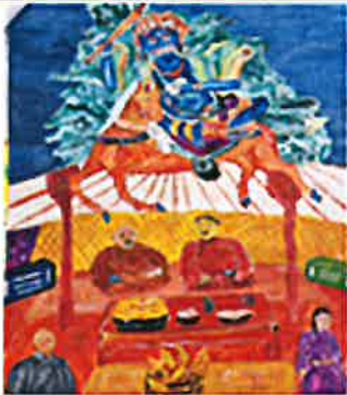
2022 우수 몽골 도르노고비아йма크 설날