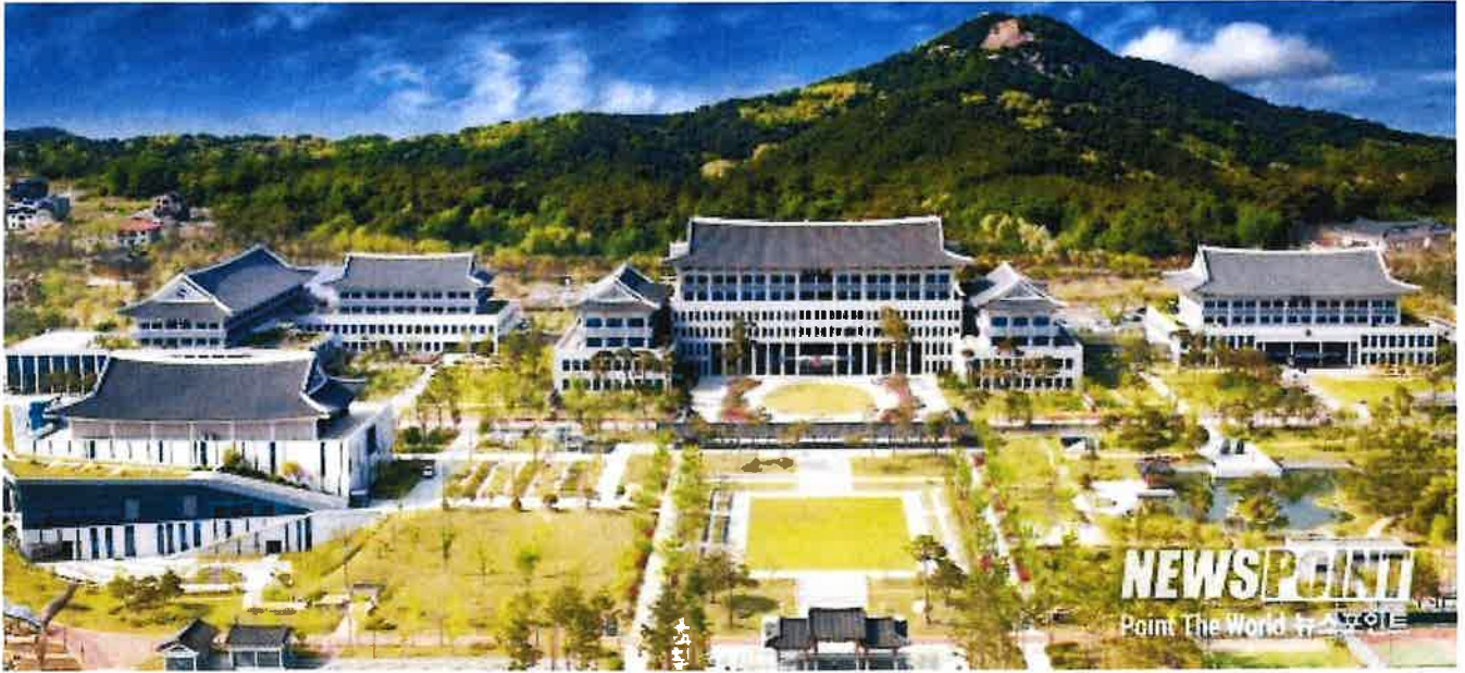
▲ 경북도 동북아 5개국 문화, 그림으로 만난다!

뉴스포인트 박마틴 기자 | 동북아시아지역자치단체연합(NEAR)사무국은 8월 14일부터 12월 15일 까지 4개월간 경상북도를 시작으로 포항시, 울산광역시, 광주광역시, 세종특별자치시에서 동북아 5개국(한·중·일·몽·러) 청소년 그림 공모전 수상작 순회 전시회를 개최한다.